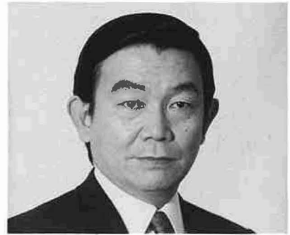
社団法人 日本ギター連盟会長 与謝野 馨

ご参加いただきました皆様、ご指導にあたってられました先生方、ご来場いただきました皆様、そしてご支援いただきました関係各位の皆様には心から感謝致しますとともに、今後とも一層のご指導、ご協力を賜りますよう厚くお願い申し上げます。