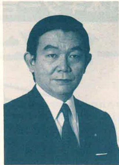
社団法人 日本ギター連盟 会長 与謝野 馨

終りに、関係者各位のご努力に対し、また、御支援いただきましたみなさんに感謝申し上げます。