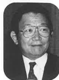
社団法人 日本ギター連盟 会長 与謝野 馨

終わりに、関係各位のご努力に対し、また、御支援いただきましたみなさんに感謝申し上げます。