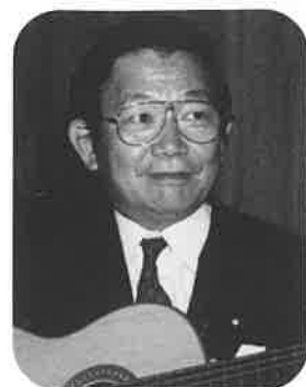
社団法人 日本ギター連盟 会長 与謝野 馨

終わりに、関係各位のご努力に対し、また、御支援いただきましたみなさんに感謝申し上げます。