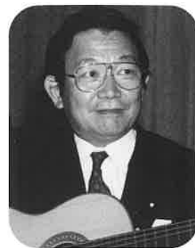
社団法人 日本ギター連盟 会長 与謝野 馨

終わりに、関係各位のご努力に対し、また、御支援いただきましたみなさんに感謝申し上げます。