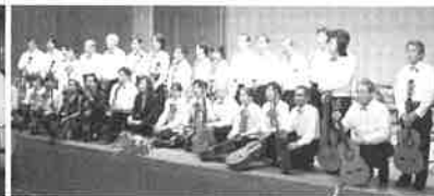
'04 12月 目黒ギターフォーラム