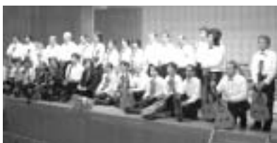
'04 12月 目黒ギターフォーラム