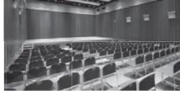
●杉並公会堂小ホール