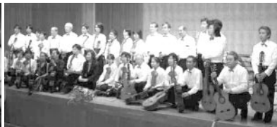
'04 12月 目黒ギターフォーラム