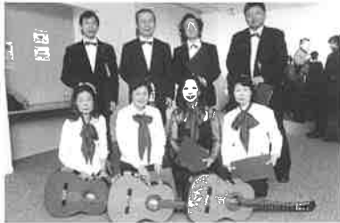
11.15.08 第5回ギターアンサンブルフェスティバル in Osaka 2008

http://www.geocities.co.jp/tokyoguitarensemble/