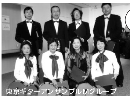
東京ギターアンサンブルMグループ